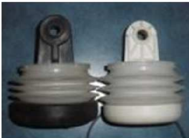
Antiguo y Nuevo bellows