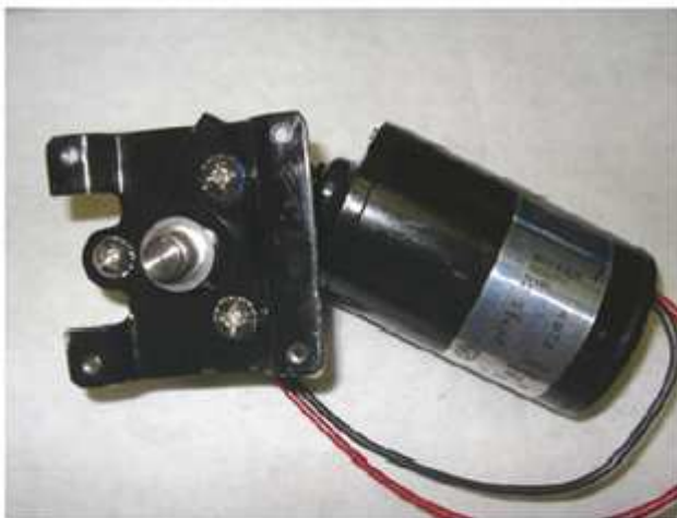
Antiguo Motor Leeson

Se ha creado un kit completo de conversión que contiene el motor W, el bellow, los o'rings y el clamp. La referencia del kit es 385311423 para 12VDC o 385311424 para 24VDC.