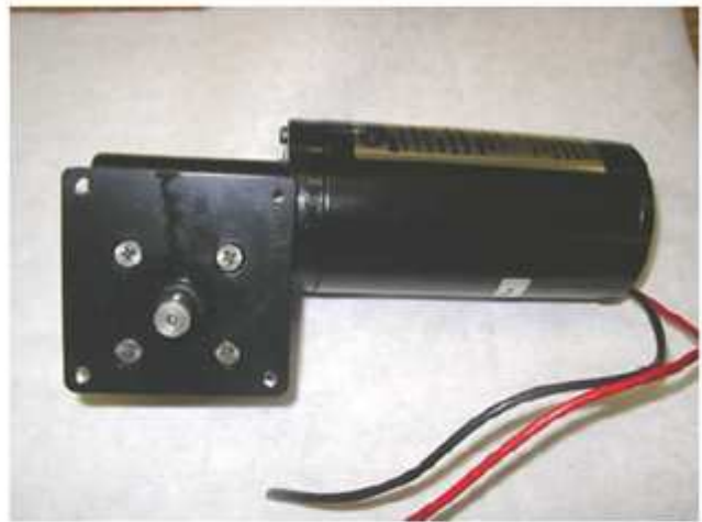
Nuevo W Motor